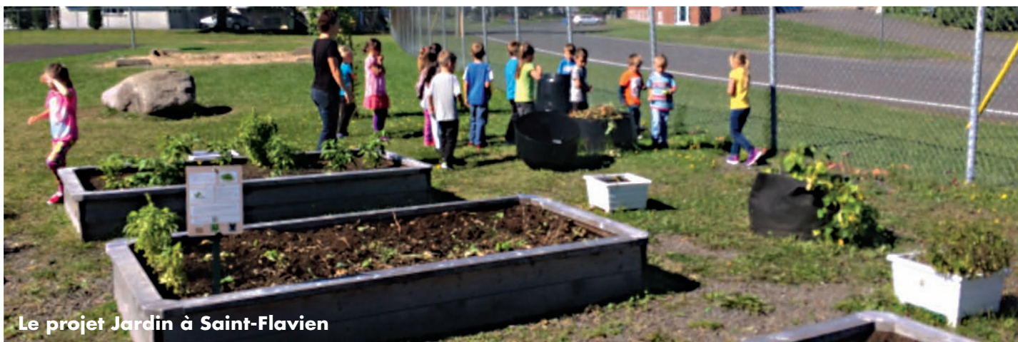
Le projet Jardin à Saint-Flavien