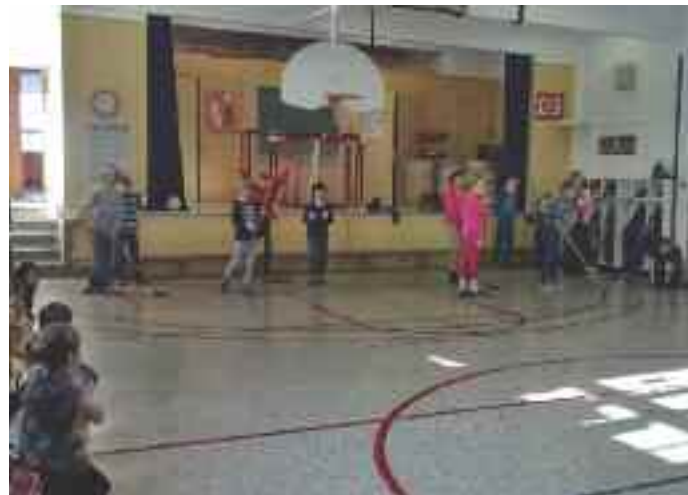
Curling en salle