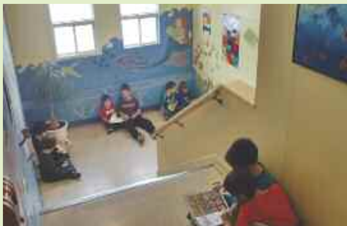
La relève en lecture