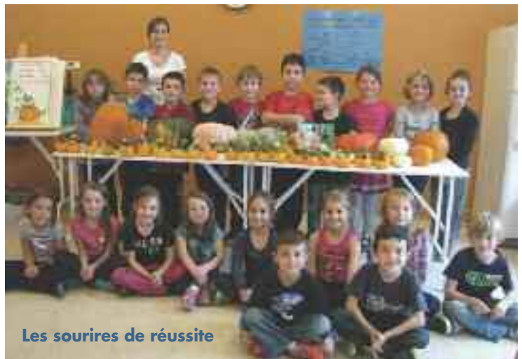
Les sourires de réussite

Le respect, l'harmonie et la sécurité des élèves sont des valeurs prônées par chacun des membres du personnel. De plus, ces derniers travaillent sans relâche pour offrir aux enfants un cadre dynamique et enrichissant.