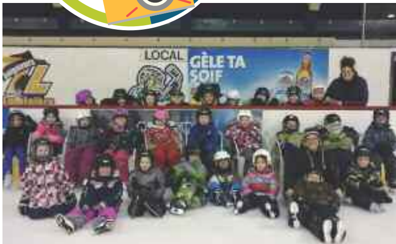
Pratique de patin