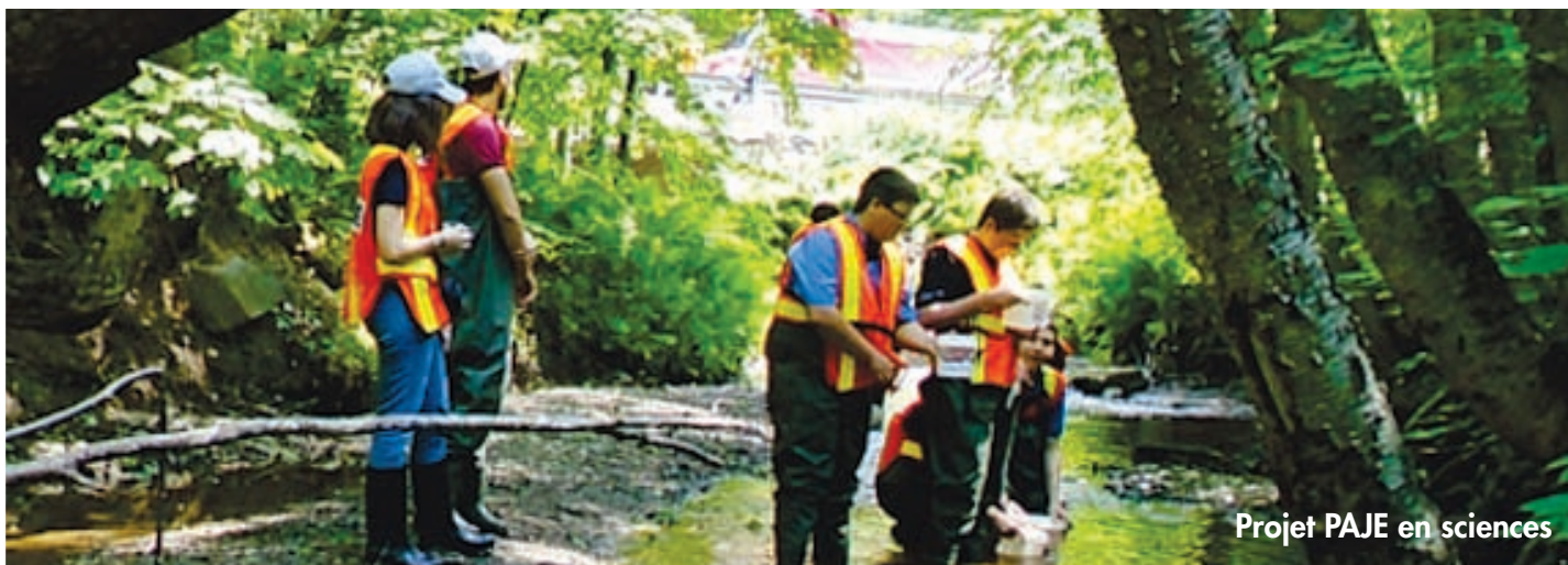
Projet PAJE en sciences