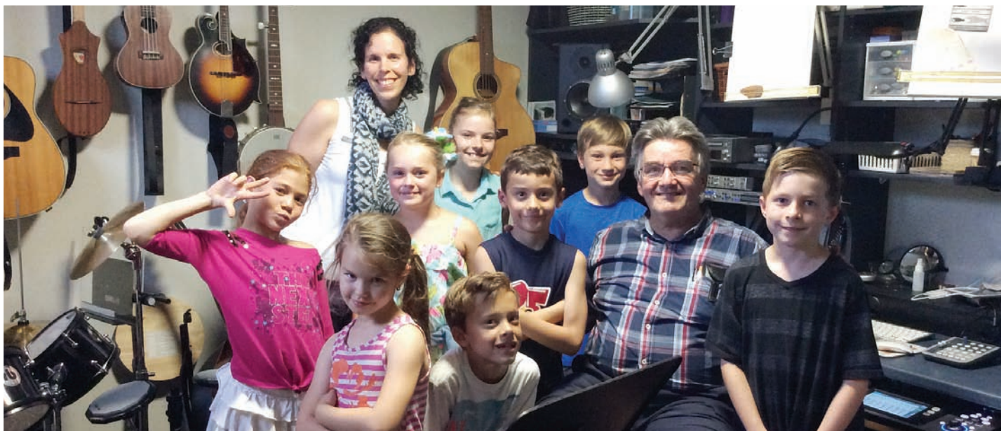
Enregistrement de la chanson thème de l'école