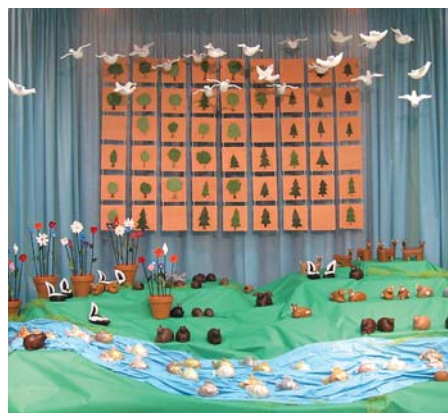
Projet artistique environnemental « Chanter la Terre ».