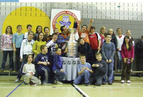
L'École de la Ruche reçoit la « Coupe Stanley ».