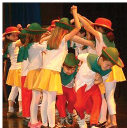
Comédie musicale « La Mélodie du Bonheur ».