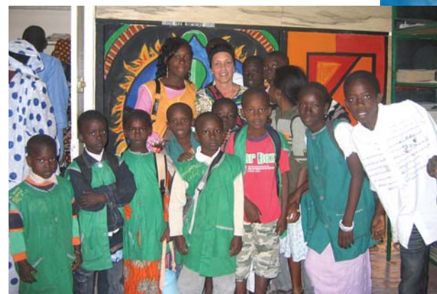
Projet entrepreneurial « Une bibliothèque pour une école du Sénégal ».