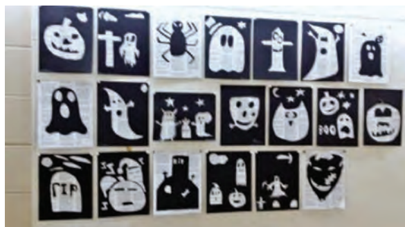
Activité culturelle sous le thème de l'Halloween !