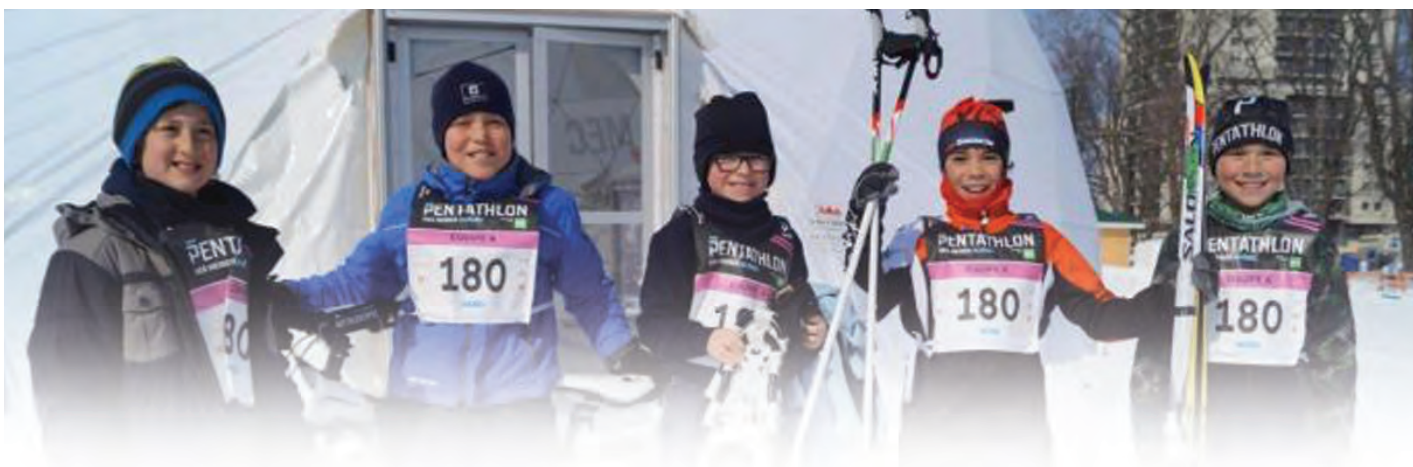
Le Pentathlon des Neiges 2015