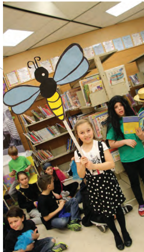
Projet NoteRythme de Radio-Canada