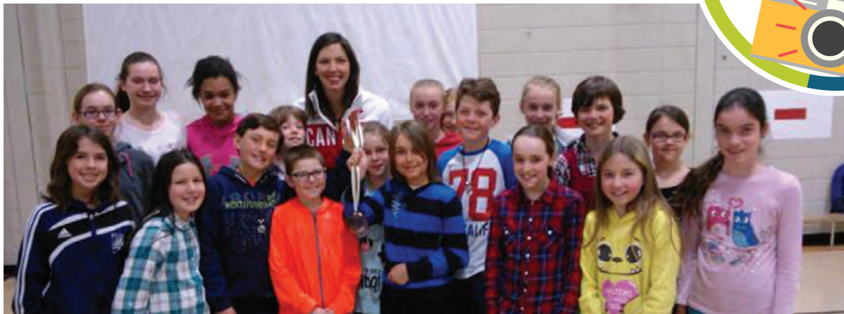
Visite de Caroline Calvé, athlète olympique