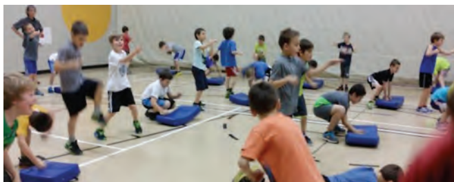
Notre projet « réseau des sports (RDS) »