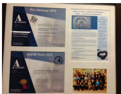
Prix Mésange pour le service de garde « La bande à Nimée »