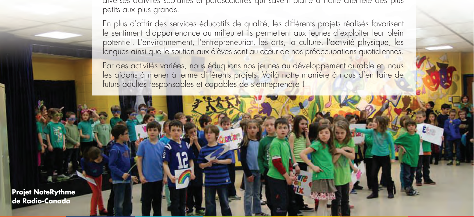
Projet NoteRythme de Radio-Canada

Par des activités variées, nous éduquons nos jeunes au développement durable et nous les aidons à mener à terme différents projets. Voilà notre manière à nous d'en faire de futurs adultes responsables et capables de s'entreprendre !