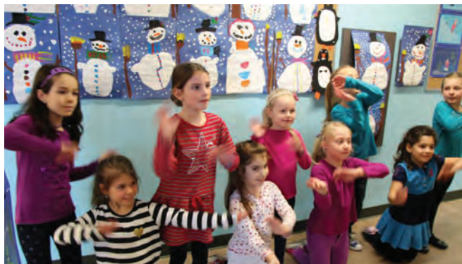
Projet NoteRythme de Radio-Canada