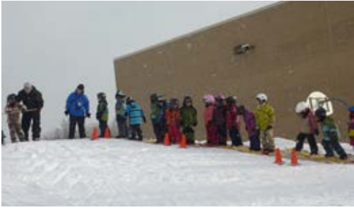
Iniski au préscolaire, tout un défi !