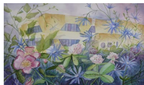
L'École de la Ruche, une école où il fait bon grandir...

Sise au coeur du quartier de Saint-Rédempteur, l'École de la Ruche accueille des élèves du préscolaire à la sixième année. Dotée d'un service de garde dynamique « la Bande à Nimée », notre école offre diverses activités parascolaires au goût des jeunes. Les différents projets que nous offrons favorisent le sentiment d'appartenance à l'école et aident nos jeunes à exploiter leur plein potentiel. L'environnement, l'entrepreneuriat, les arts, la culture, l'activité physique, les langues, le soutien aux élèves sont au coeur de nos préoccupations et guident nos décisions au quotidien. Par des activités variées, nous éduquons nos jeunes au développement durable, nous les aidons à mener à terme des projets, à développer leur sens artistique et les encourageons à développer et maintenir de saines habitudes de vie.