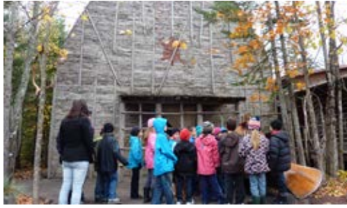
Visite au Village Huron, de belles découvertes !