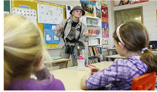
Nos aidants scolaires, un coup de pouce magique !