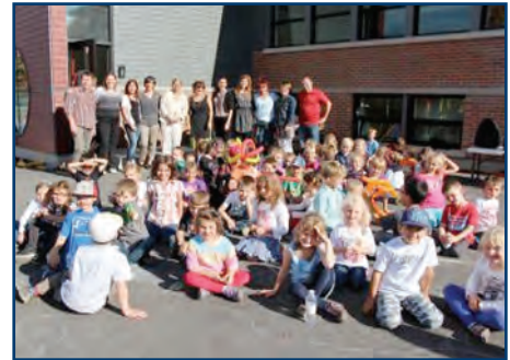
Ouverture de l'École Dominique-Savio