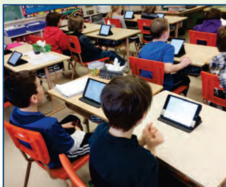
Projet technologique en 3 e année