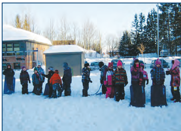
On profite de l'hiver à Dominique-Savio !