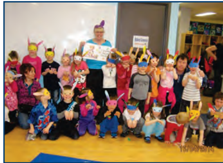
Projet du service de garde « Un conte pour Pâques »