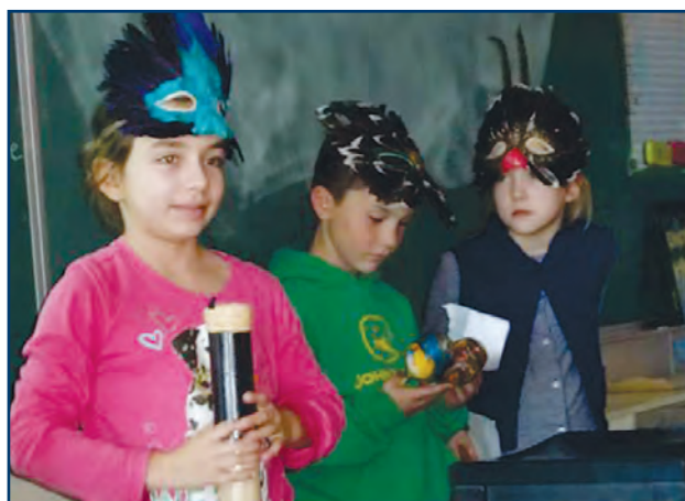
Activité culturelle en direct du Mexique !