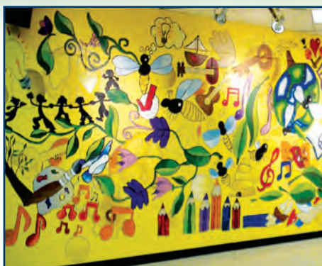
Fresque réalisée à la bibliothèque par les élèves de la Ruche