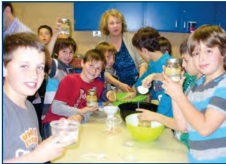
L'entrepreneuriat au service de garde