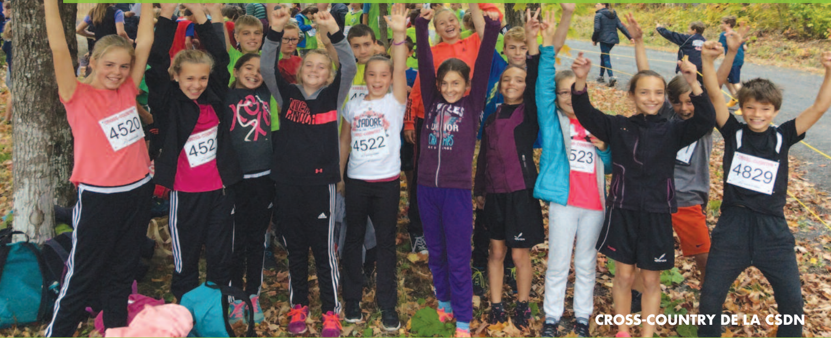
CROSS-COUNTRY DE LA CSDN