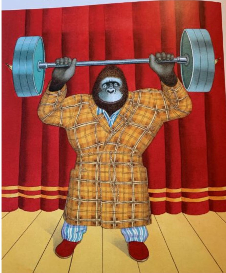
Mon papa , Anthony Browne, Kaléidoscope, 2000. Non paginé.