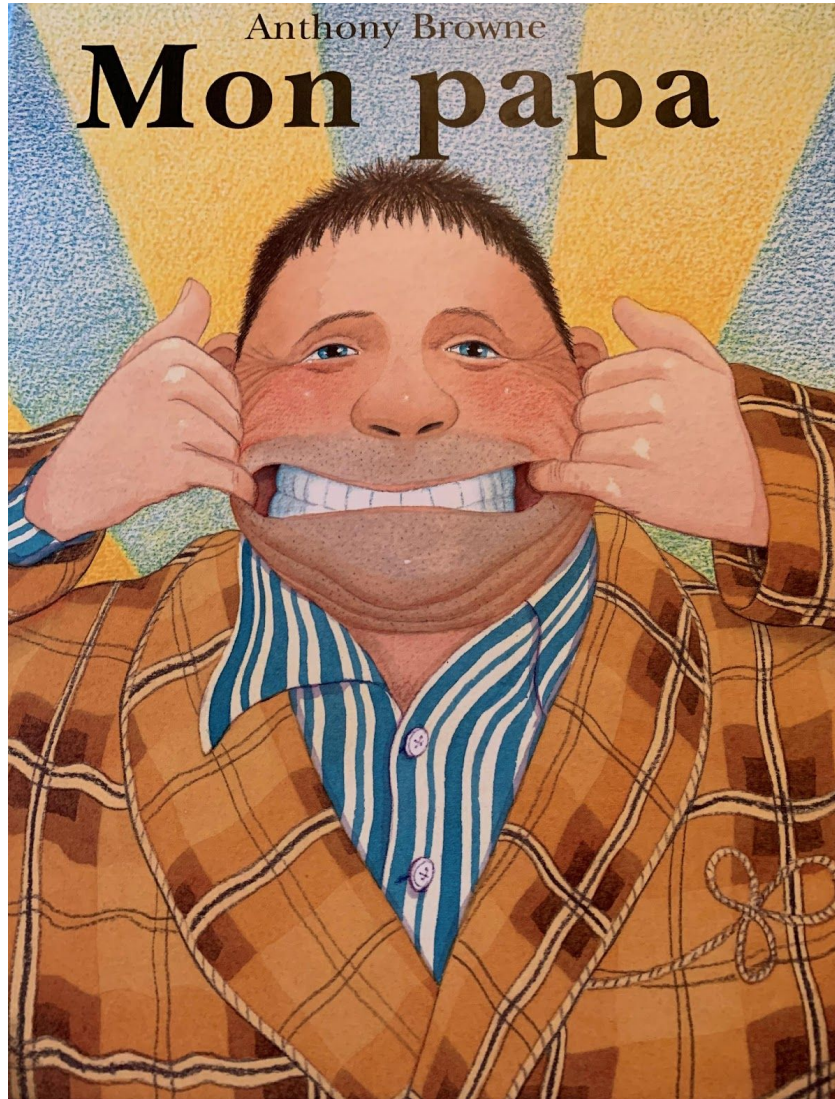
Mon papa, Anthony Browne, Kaléidoscope, 2000. Non paginé.

Observe les trois illustrations pour te donner des idées.